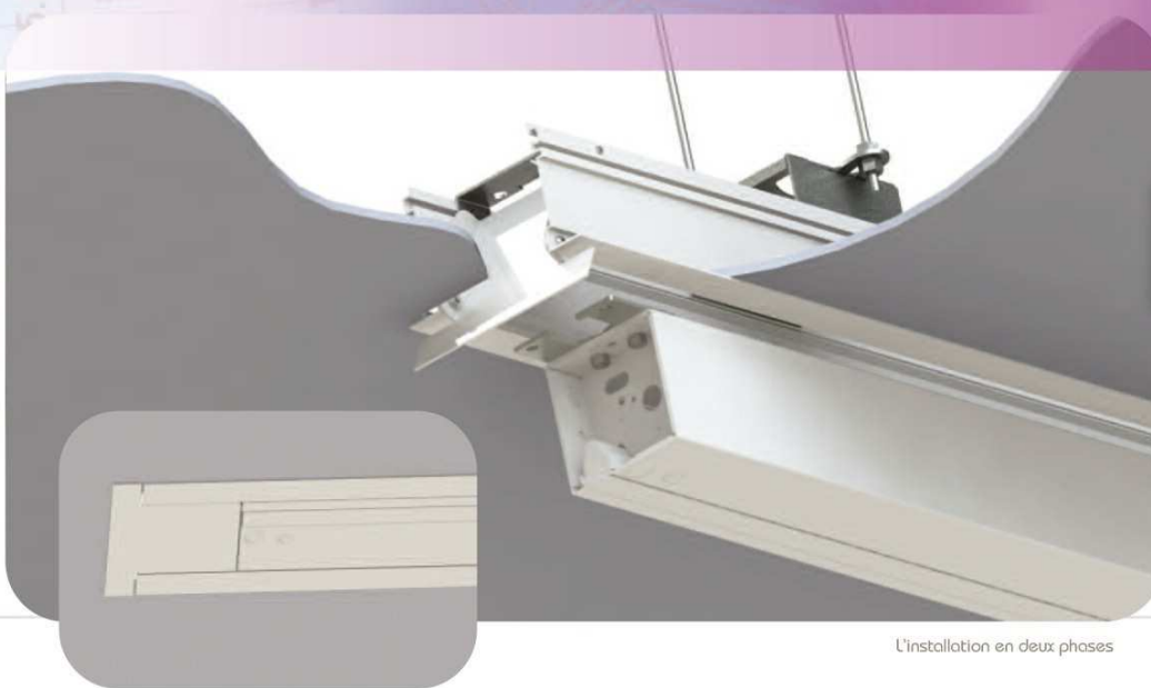
L'installation en deux phases