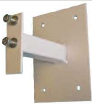
Patte d'écartement (la paire) Réf. OPTECAR10BSQ