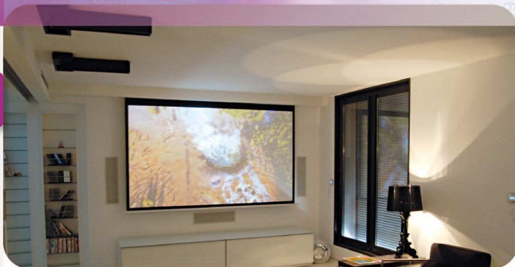
Square HC - Crédit Photo : "Cinelounge - HomeCine'Feel"