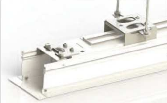
L'installation en une phase